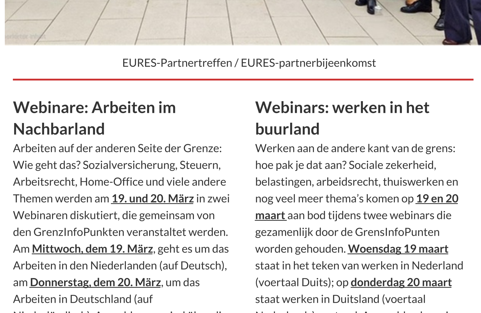
EURES-Partnertreffen / EURES-partnerbijeenkomst

De doelen voor 2025 zijn dan ook: het bereik van EURES uitbreiden, onderlinge structuren versterken, de matching-kwaliteit verhogen, de beschikbare informatie op het EURES-portal verbeteren en meer gebruikmaken van Europese subsidies, om zo nog meer werkzoekenden aan een nieuwe baan te helpen.